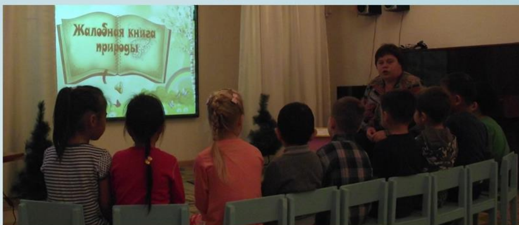
Игра «Чьи следы?»