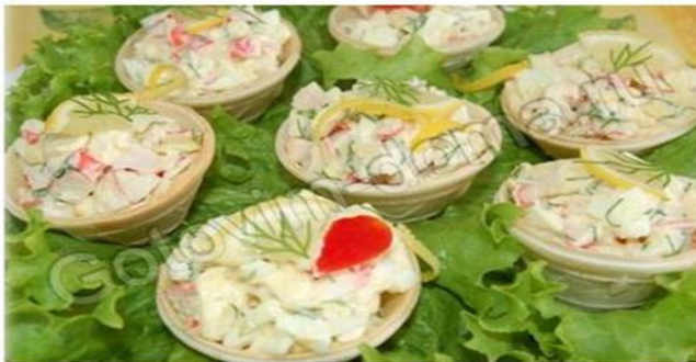
Салат "Крабик" в тарталетках

Состав готовые тарталетки или корзиночки крабовые палочки - 200 г, сыр - 100 г, яйца - 3 шт., чеснок - 2 дольки, укроп, майонез Приготовление Яйца отварить вкрутую, очистить и порубить. Крабовые палочки порезать кубиками или соломкой. Сыр нарезать кубиками или натереть на терке.